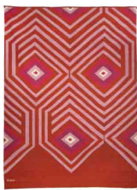
II Medida: 240 x 170 cms Tintes: Marush, Grana cochinilla y Añil índigo Material: Algodón y lana 100% natural Técnica: telar de pedal Hecho 100% a mano