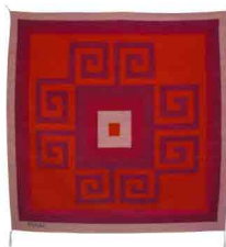
IV Medida: 130 x 130 cms Tintes: Grana cochinilla y Añil índigo Material: Algodón y lana 100% natural Técnica: telar de pedal Hecho 100% a mano