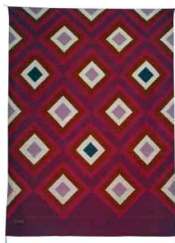
III Medida: 160 x 215 cms Tintes: Marush, Grana cochinilla y Añil índigo Material: Algodón y lana 100% natural Técnica: telar de pedal Hecho 100% a mano