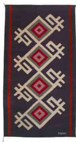
VII Medida: 90 x 170 cms Tintes: Marush, Grana cochinilla y Añil índigo Material: Algodón y lana 100% natural Técnica: telar de pedal Hecho 100% a mano