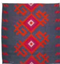
V Medida: 160 x 160 cms Tintes: Grana cochinilla y Añil índigo Material: Algodón y lana 100% natural Técnica: telar de pedal Hecho 100% a mano