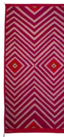
VI Medida: 90 x 200 cms Tintes: Grana cochinilla y Añil índigo Material: Algodón y lana 100% natural Técnica: telar de pedal Hecho 100% a mano