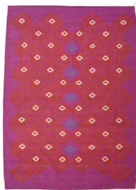
I Medida: 240 x 170 cms Tintes: Marush, Grana cochinilla y Añil índigo Material: Algodón y lana 100% natural Técnica: telar de pedal Hecho 100% a mano